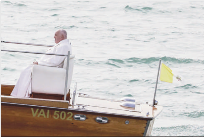
« Ne lâchez rien »

Il a débuté sa visite à Venise dans une prison pour femmes, où il a appelé le système pénitentiaire à « créer les conditions d'une réinsertion saine ». Arrivé en hélicoptère directement dans la cour de la prison de l'île de la Giudecca, qui abrite le pavillon du Saint-Siège à la 60e Biennale d'art contemporain de Venise, François a longuement salué une par une les quelque 80 détenues, le personnel administratif et pénitentiaire et les bénévoles.