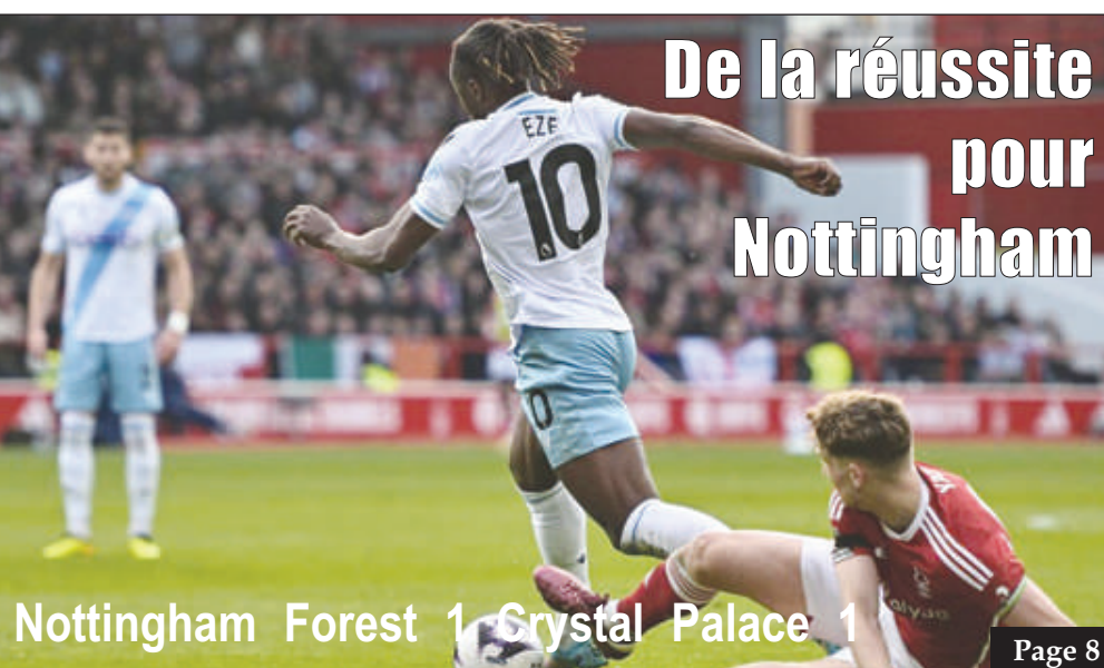
Nottingham Forest 1 Crystal Palace 1