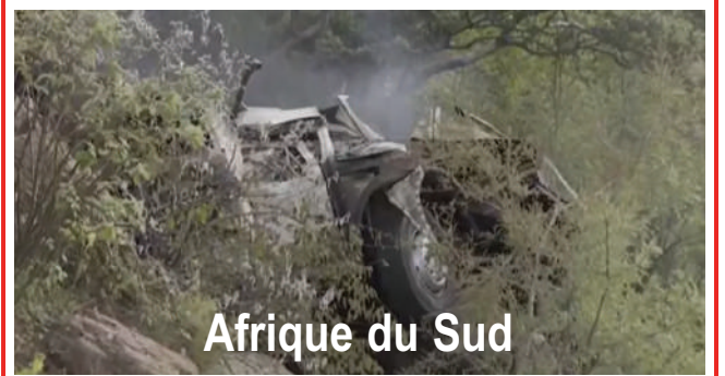
Afrique du Sud