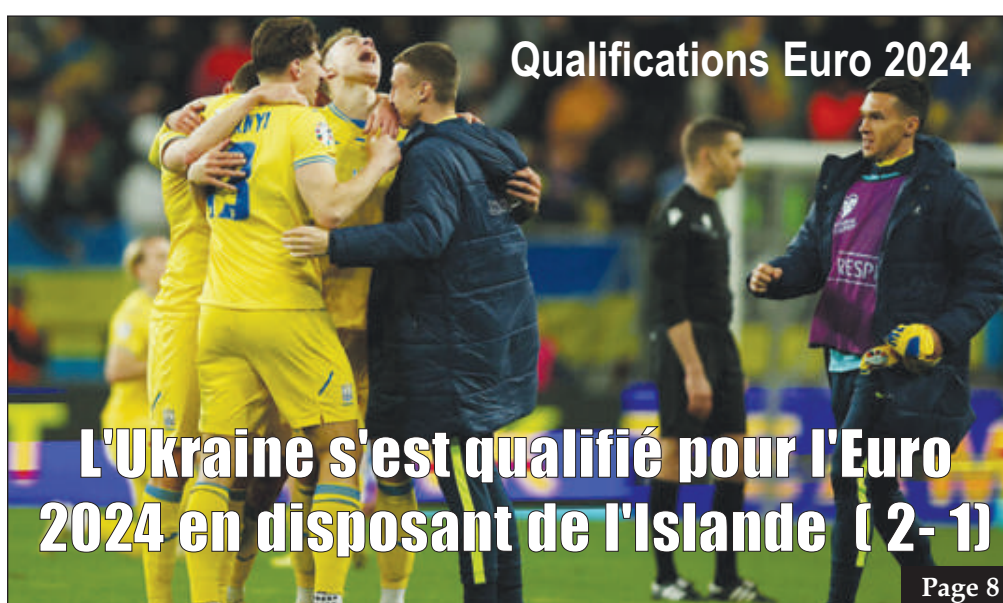
Qualifications Euro 2024