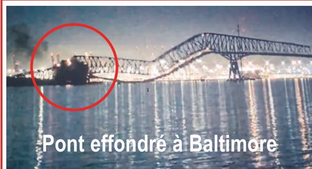
Pont effondré à Baltimore