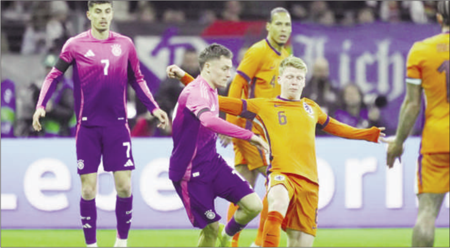
l'Allemagne dans le match (11e).

Pourtant piquants dès les premières secondes face aux Bleus, les Allemands se sont fait surprendre en tout début de match, lorsque Memphis Depay a débordé un Jonathan Tah déboussolé avant de servir Joey Veerman à l'entrée de la surface. La reprise de volée de ce dernier a fait mouche (4e). Fautif sur cette action, Maximilian Mittelstädt a pris ses responsabilités moins de 10 minutes plus tard. Servi par Jamal Musiala après un corner joué rapidement, le défenseur de Stuttgart a trouvé la barre rentrante d'une jolie frappe pour remettre