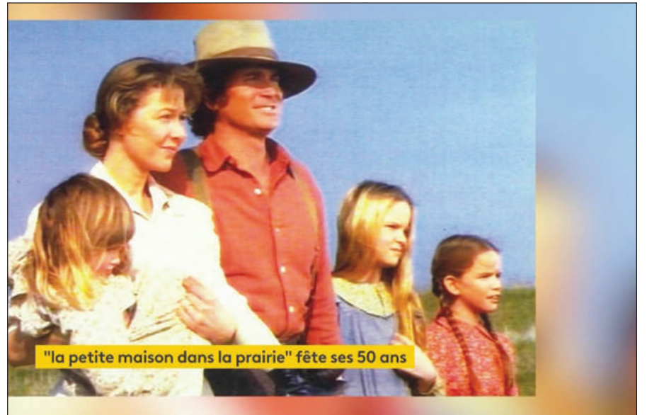
"la petite maison dans la prairie" fête ses 50 ans

Malgré les décennies passées, les fans sont encore nombreux. En