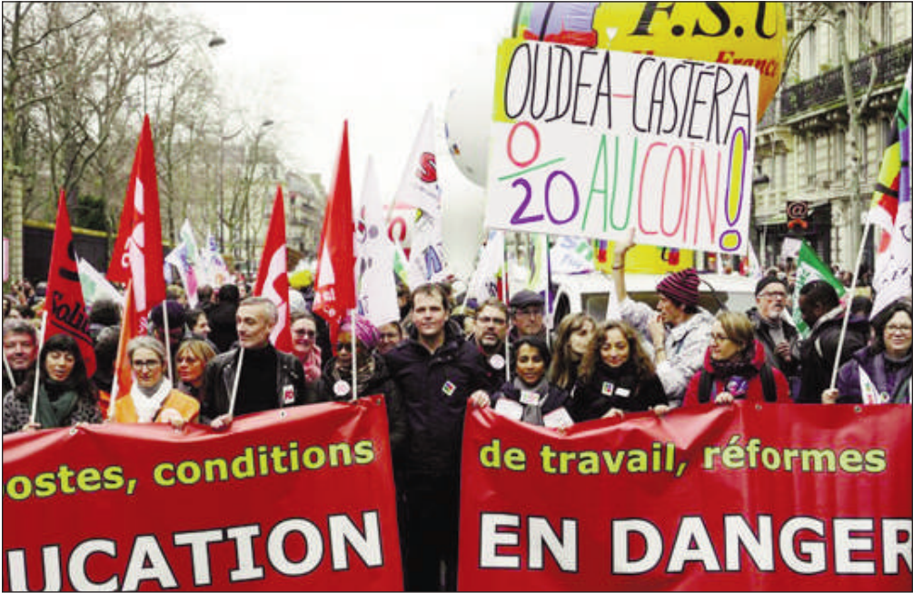
les députés de la commission des Affaires culturelles et de l'Éducation de l'Assemblée nationale sur son action.

Cette nouvelle grève intervient le jour où la ministre de l'Éducation et des Sports, Amélie Oudéa-Castéra, est auditionnée par