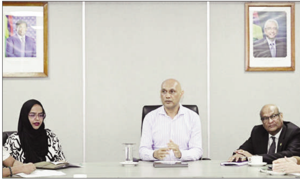
Le ministre a souligné les mesures de précaution visant à éviter la propagation des