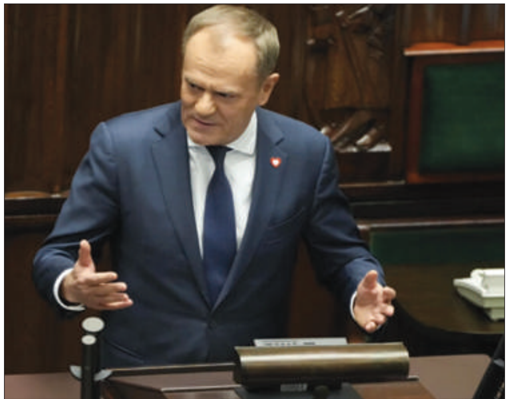
légalité, qui ont créé le débat dans le pays. Pologne était bel et bien de retour dans l'Union. Assez pour convaincre l'Europe que la

Et ces dernières semaines, il s'est empressé d'amorcer une réforme pour rendre aux médias publics leur indépendance, et nommer un nouveau Procureur général. Des mesures expresses, à la limite de la