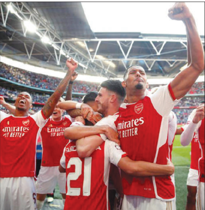
Mikel Arteta a reçu un coup dur lors de la victoire 4-3 d'Arsenal contre son rival de Premier League, Luton Town. Les célébrations de Mikel Arteta après le vainqueur tardif d'Arsenal à Luton Town mardi soir ont eu un coût.

Les Gunners se sont imposés dans un thriller dramatique de sept buts à Kenilworth Road lorsque la recrue est-ivale Declan Rice a dirigé un vainqueur à la 97e minute pour finalement briser la résistance de leurs hôtes et remporter les trois points pour son équipe. Le but a déclenché de folles célébrations parmi le soutien itinérant et ces scènes ont été identiques sur la ligne de touche alors qu'Arteta et son équipe d'entraîneurs ont naturellement affiché leur exaltation face à ce qui pourrait être une grande victoire dans leur quête du titre de Premier League.