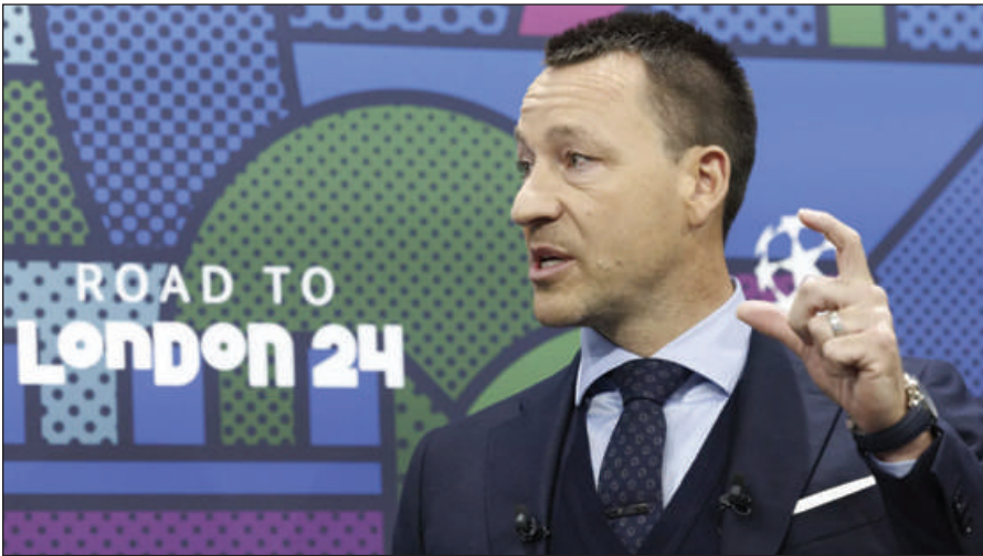
Barcelone, la Real Sociedad ou encore l'Atlético de Madrid. Et les joies du tirage au sort ont décidé d'une double confrontation entre le PSG et la Real Sociedad.

Le Paris Saint-Germain est le seul représentant français sur cette phase finale de LDC, mais les Franciliens ont eu beaucoup de mal à sortir de leur groupe ! En effet, les Rouge-et-Blanc ont terminé à la 2ème place de leur poule, derrière le Borussia Dortmund, et vont donc tomber sur un gros club européen dès les 8èmes de finale. Parmi les cadors, Paris pouvait tomber sur le Real Madrid, Manchester City, Arsenal, le Bayern Munich, le FC