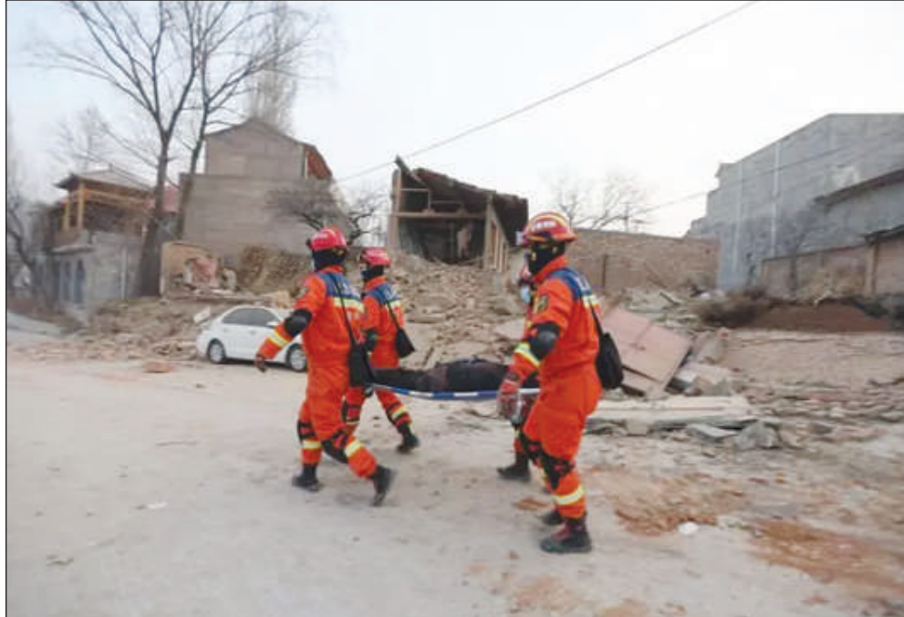
"J'ai failli mourir de peur"

Une autre secousse de magnitude 5,2 selon USGS a été détectée lundi matin dans la province du Xinjiang, qui jouxte le Gansu à l'ouest.