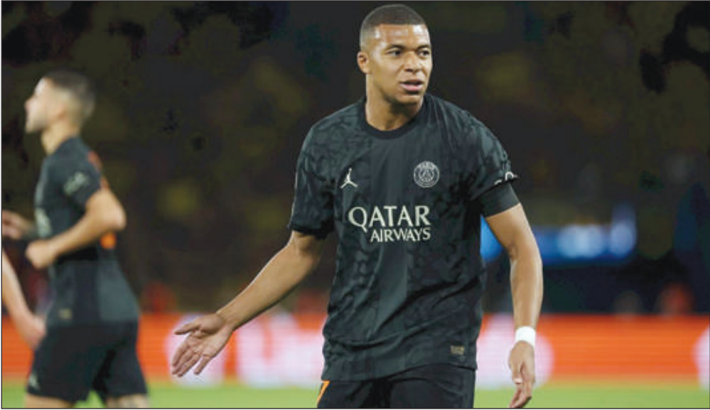
Mbappé a réveillé Francis-Le Blé

Mais après une frappe dégagée par Marco Bizot (5e), Warren Zaïre-Emery trompait le portier néerlandais d'un missile