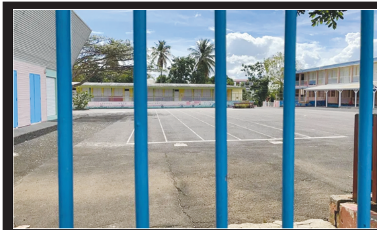
Le rectorat ne sera pas ouvert au public. Il convient de noter que cette mesure ne s'applique pas pour l'instant aux écoles et établissements scolaires de Saint-Martin et de Saint-Barthélemy.

La Martinique, quant à elle, devrait échapper aux vents les plus violents. Néanmoins, on prévoit des conditions météorologiques instables, avec des pluies