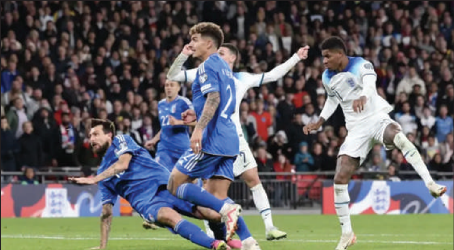
John Stones est revenu pour empêcher Frattesi de taper sur le retrait de Di Lorenzo. Donnarumma a dû arrêter Marcus Rashford au deuxième poteau, tandis que Jordan Pickford s'est mis à parer la frappe de Destiny Udogie, Berardi et Di Lorenzo n'ayant pas réussi à récupérer le rebond. Phil Foden a fait appel de pénalités, mais a été jugé comme étant tombé sur Udogie, tandis que Calvin Phillips a explosé depuis l'extérieur de la zone. L'Angleterre a renversé la situation

Les Azzurri ont effectué un mouvement très similaire vers le but, mais cette fois,