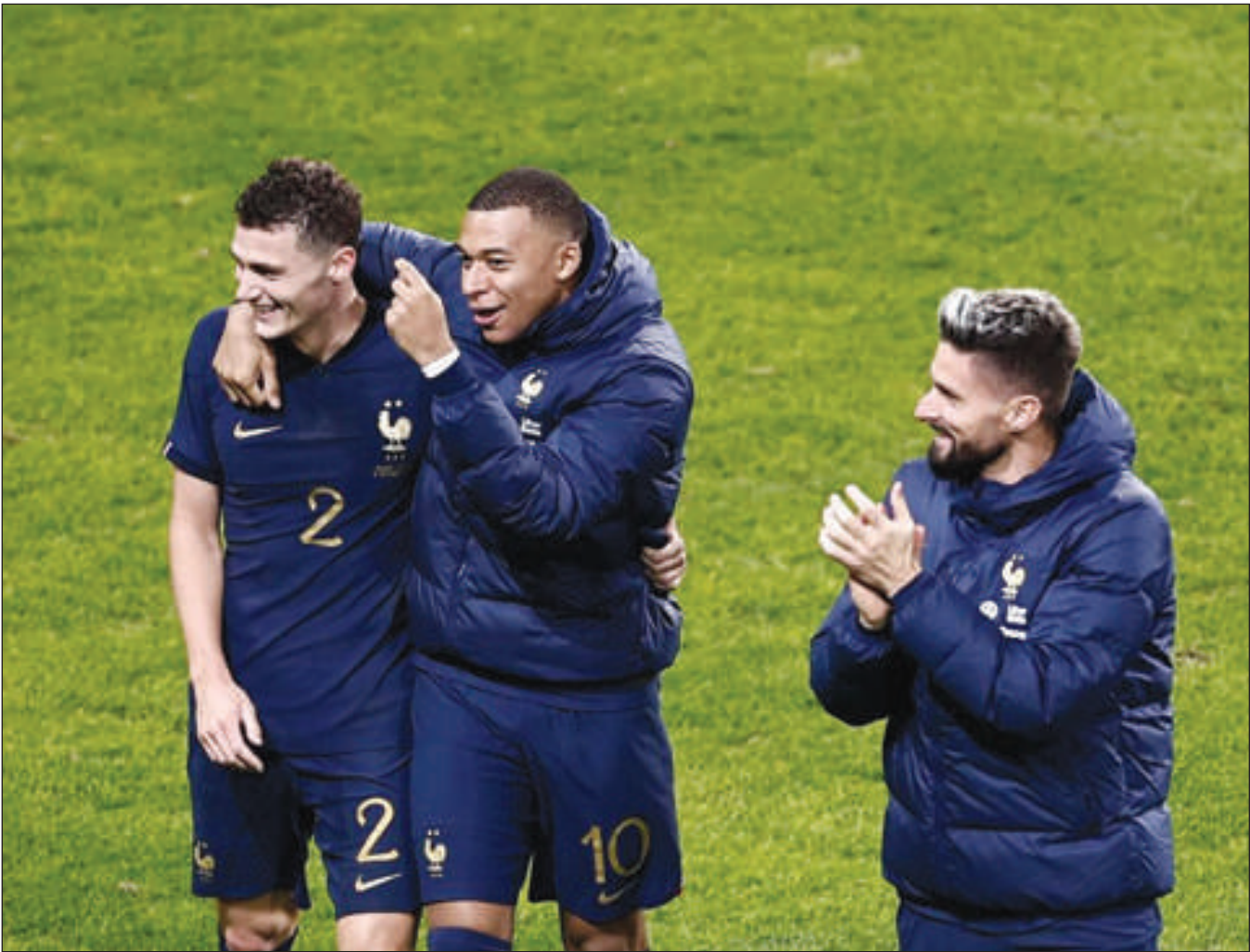
leurs automatismes offensifs. Kylian Mbappé a inscrit son 43e but chez les Bleus en transformant un penalty obtenu par Olivier Giroud (3-1, 41e). Entré en seconde période, Kingsley Coman a parachevé le festival offensif des Bleus en étant à la conclusion d'un beau mouvement collectif initié par Kylian Mbappé et Marcus Thuram (4-1, 70e).

L'ancien joueur du Bayern Munich aurait même pu entrer dans l'histoire quelques instants plus tard s'il avait conclu un nouveau caviar de l'attaquant du PSG (37e). En effet, aucun défenseur n'a inscrit de triplé dans l'histoire de l'équipe de France. Dynamisés par ce doublé pour le moins surprenant du défenseur, les Bleus ont ensuite retrouvé