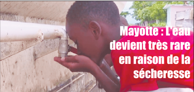
À Mayotte, la sécheresse est telle que des mesures radicales sont prises. L'eau va être coupée deux jours sur trois. La situation est très délicate pour la population.