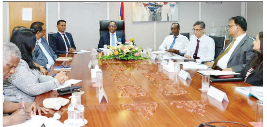
Tanzanie ; Participation au programme de remboursement des foires internationales pour les PME.

Selon lui, ces statistiques montrent que les programmes de soutien mis en place par le gouvernement pour améliorer la compétitivité du secteur exportateur y contribuent favorablement. Ces programmes comprennent : le programme de remise sur le fret ; Programme d'appui à la promotion commerciale et à la commercialisation ; Régime d'assurance-crédit à l'exportation ; Programme d'entreposage en Afrique en