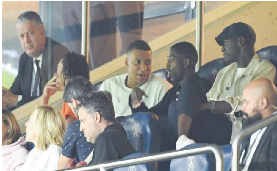
figure jugé inacceptable par les dirigeants parisiens.

Mbappé et Paris étaient entrés dans un bras de fer sévère depuis l'envoi en juin d'un courrier par le capitaine de l'équipe de France annonçant sa volonté d'aller au bout de son contrat, qui expire en juin 2024, sans le prolonger. Un cas de