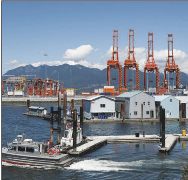
Colombie-Britannique, la province la plus occidentale du Canada, dit s'être « efforcée à plusieurs reprises de faire preuve de souplesse et de trouver un compromis sur les

De son côté, l'Association des employeurs maritimes de