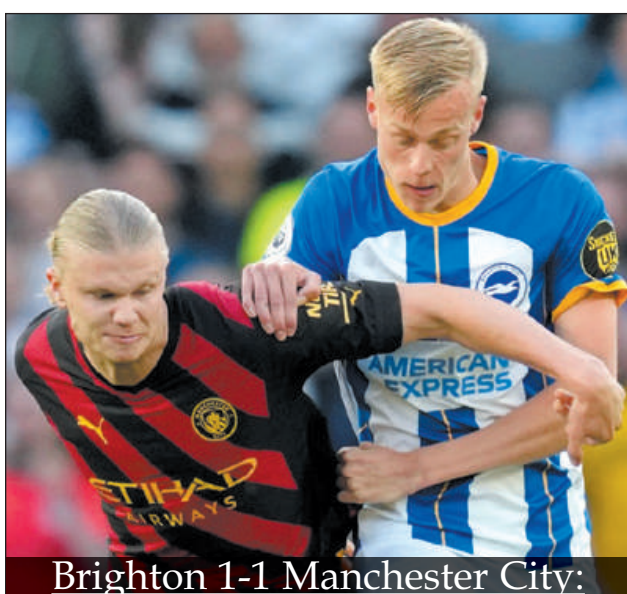
Brighton 1-1 Manchester City: