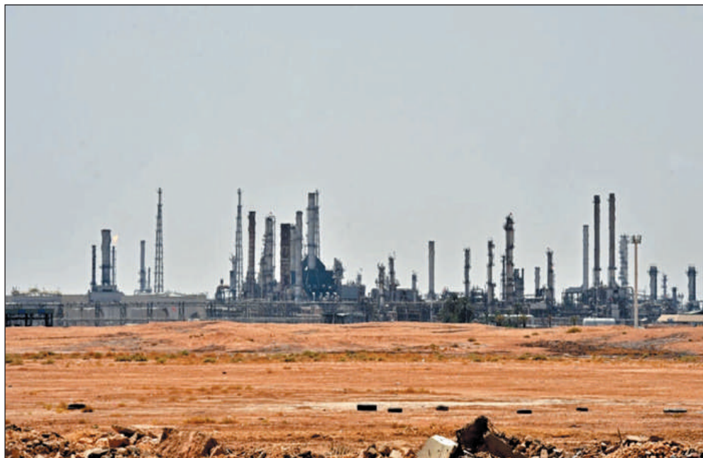
"Élément de surprise"

Ces baisses auront lieu à partir de mai jusqu'à fin 2023. Elles ont lieu "en coordination avec certains pays membres de l'Opep et non membres de l'Opep", selon le ministère algérien de l'Énergie.