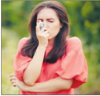
Efficacité de 3 mois

À l'heure actuelle, les corticoïdes inhalés sont les médicaments de référence pour contrôler l'asthme. Cependant, dans le cas d'asthme allergique sévère, ce traitement ne suffit pas toujours et le recours à des traitements coûteux doit être envisagé.