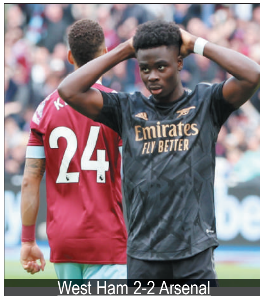
West Ham 2-2 Arsenal