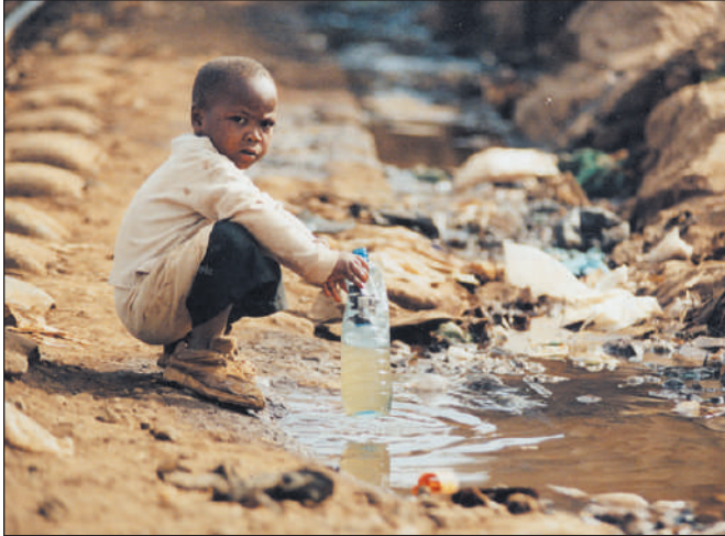
Des situations inégales face à l'eau

M algré les investissements importants déployés ces dernières années, le compte n'y est pas pour l'Afrique. La démographie et l'accroissement de l'urbanisation n'ont pas permis sur ces trente dernières années d'améliorer substantiellement la vie des femmes et des hommes. Si l'enjeu est prioritairement sanitaire, et donc politique, il revêt aussi une grande dimension économique, car le développement du secteur de l'eau et de l'assainissement est créateur de milliers d'emplois locaux et pérennes.