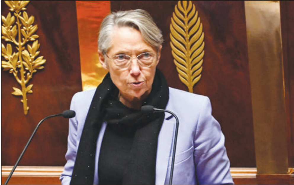
Une première dans l'histoire de la Ve République

Un PLFSSR permet en effet une nouvelle utilisation d'un 49.3 par le gouvernement – l'utilisation de cet article n'étant pas limitée sur les lois de finances, tandis qu'un seul est autorisé par session parlementaire sur les autres textes –, mais pourrait aussi entraîner, comme le révélait Politico, une accélération de l'examen du projet de loi grâce à l'article 47.1 de la Constitution, qui limite à cinquante jours les discussions au Parlement.