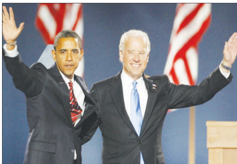
"Placard fermé à clé"

Le procureur général des États-Unis, Merrick Garland, avait demandé que les documents soient examinés par des procureurs de Chicago avant qu'ils ne soient remis au service national des Archives, chargées de préserver ce type d'actes, a ajouté CBS News. La police fédérale (FBI) a aussi ouvert une enquête.