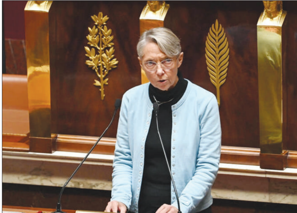
Plusieurs revers lors des débats sur le budget