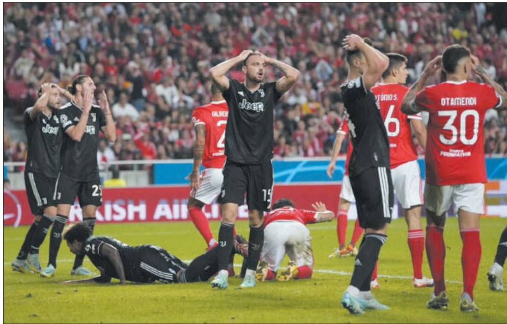
défaite de Salzbourg.

Le club italien, qui reçoit son homologue autrichien lors de la dernière journée mercredi prochain, a son destin entre ses mains : un nul à San Siro lui suffira pour accéder aux huitièmes de finale. Le Dinamo Zagreb, de son côté, a encore un mince espoir d'être reversé en Ligue Europa : il lui faudra aller s'imposer à Chelsea, et espérer une