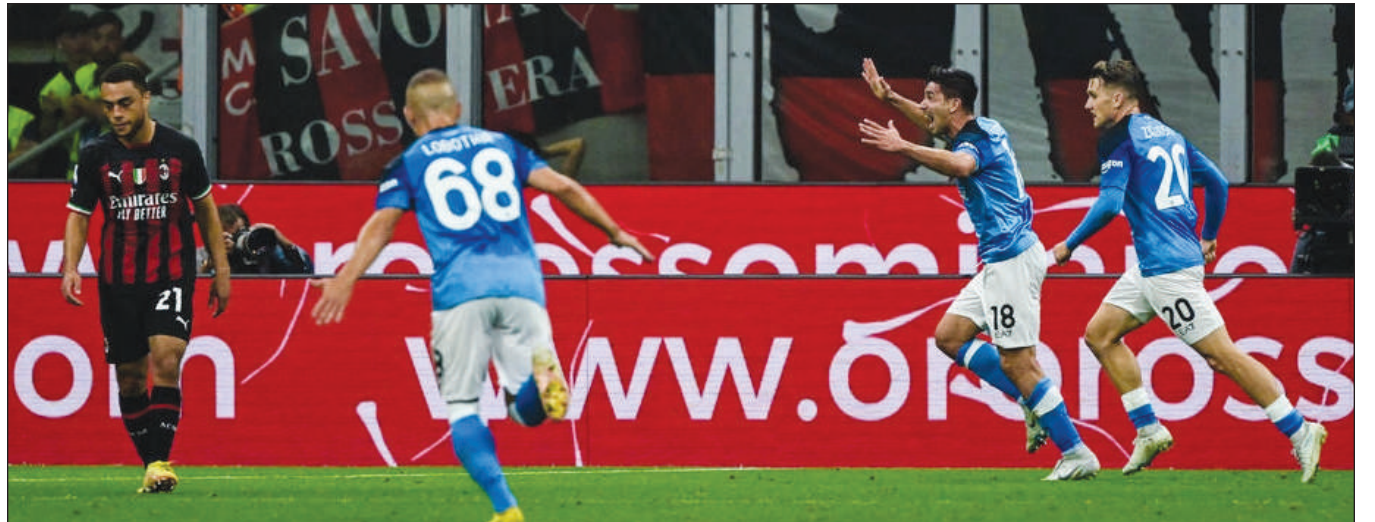
L'attaquant argentin Giovanni Simeone célèbre son but qui donne la victoire à Naples à San Siro, le 18 septembre 2022. L'AC Milan était invaincu à domicile en championnat depuis janvier dernier.