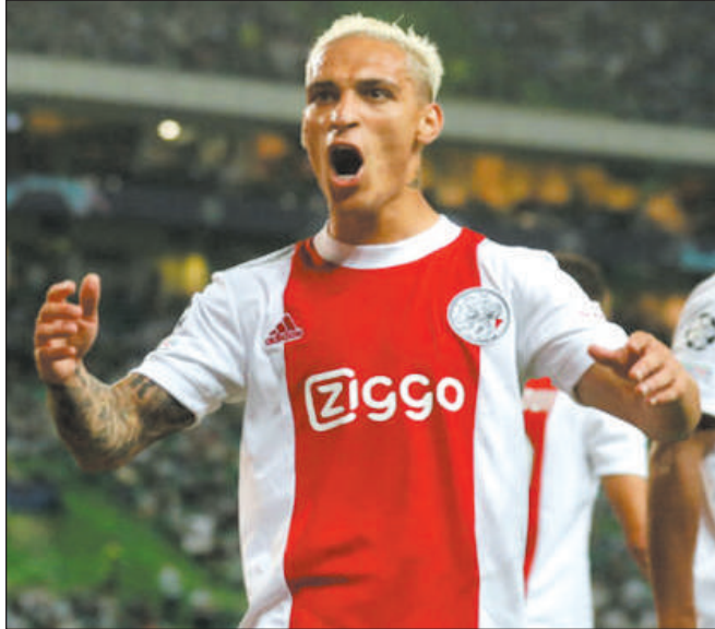
d'Arsenal à domicile ce week-end.

Mais il devrait avoir l'autorisation à temps pour affronter les anciens rivaux de United et les premiers leaders