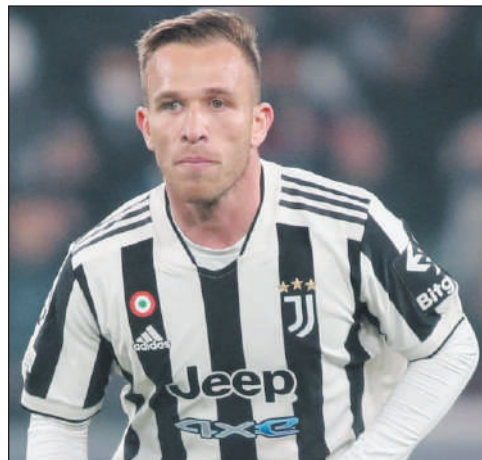
cible accessible pour les Toffees.

Arthur est excédentaire par rapport aux exigences de la Juventus, qui souhaite le décharger afin de pouvoir signer Leandro Paredes du Paris Saint-Germain. Par conséquent, l'international brésilien est une