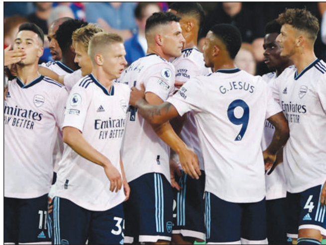
joué dans un maillot d'Arsenal toute sa vie.

Arsenal n'a pas perdu de temps pour imposer son autorité sur le jeu, ce qui a calmé la foule bruyante à domicile. Martinelli a ouvert une chance précoce après de superbes dribbles en solo de Jesus, qui avait l'air d'avoir