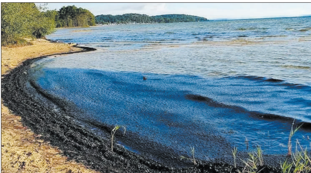
Une internaute a publié ces clichés de l'étang de Cazaux noirci par les fumées de l'incendie de La-Teste-de-Buch