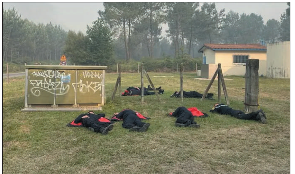
Les pompiers se reposent après une nuit de combat contre les flammes

Le maire de La Teste a également confirmé que l'incendie dans sa commune est d'origine accidentelle. C'est un petit camion qui a pris feu. "C'est un jeune, local, qui est passé sur la piste dans la forêt, sa voiture est tombée en panne, le feu est parti..."