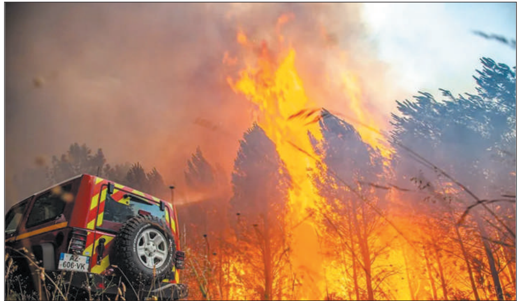
Les flammes dévorent la forêt dans le Sud-Gironde

L'étang de Cazaux (à cheval sur la Gironde et les Landes) a été noirci par les